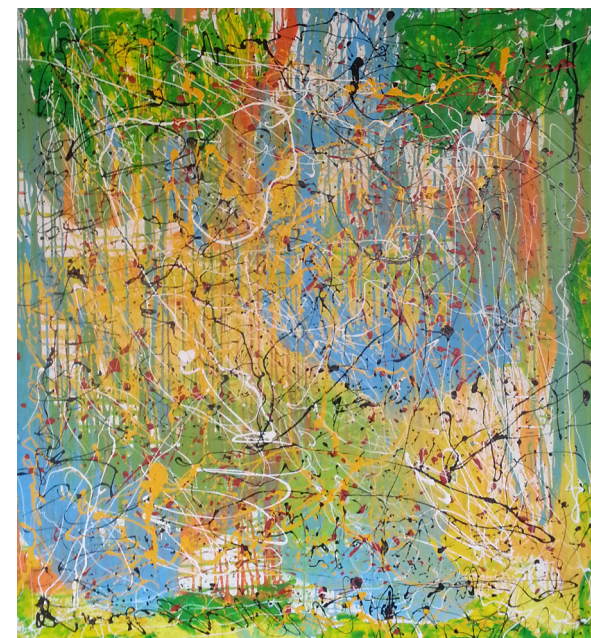
Oeuvre collective - secteur 94G10