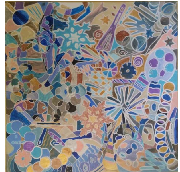
Œuvre collective-secteur 94G17

Equipe Mobile de Psychiatrie de la Personne Agée Ouest 94